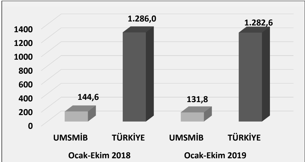
Grafik 2. UMSMİB ve Türkiye Geneli MSM / Kümülatif İhracatı